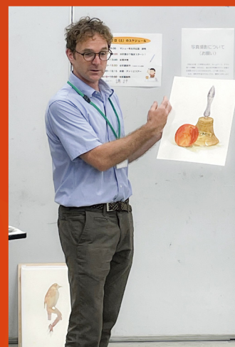
B 油絵 (水彩画)