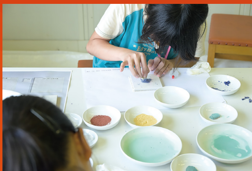
A2 日本画 (小・中学生向け)