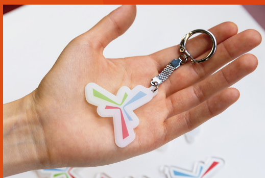
D デザイン工芸 (視覚造形)