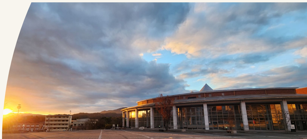
Hiroshima City University Graduate School of Peace Studies