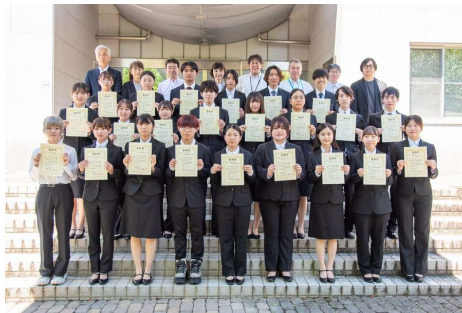
2025年度情報科学部特待生