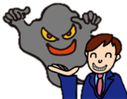
悪徳商法、 宗教の執拗な勧誘