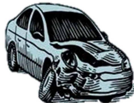
自動車・バイク事故