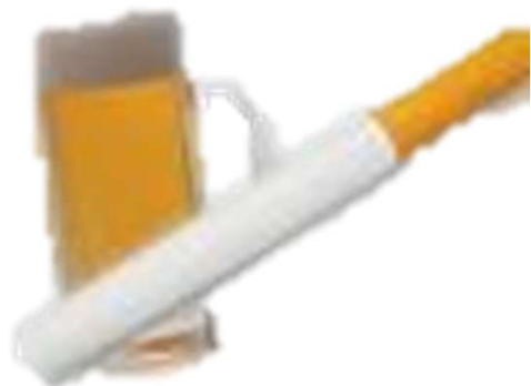
飲酒・喫煙、薬物乱用