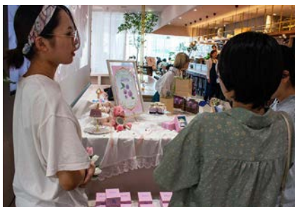
お客様からデザインを感想も聞くことができました