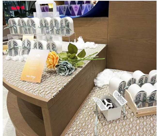
Cチーム/河原彩名 千同沙英 藤井菜々子