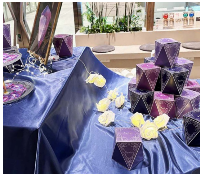
Eチーム/後藤永遠 竹田智哉里 藤原優希