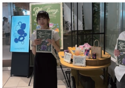
入口の外に設置した屋台で呼び込み