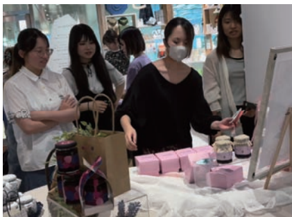
商品パッケージとともにディスプレイも設営