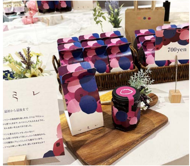
Aチーム/井上巴乃 小林夢歩 山下恭一郎 ティールトン