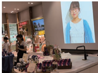
各チームリーダーによる商品紹介、PRタイム