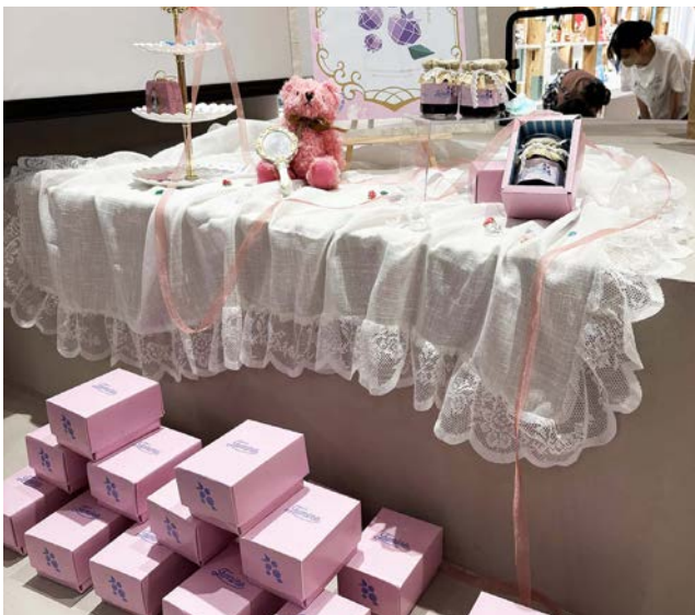
Dチーム/草間一華 高橋南帆 藤國梨音