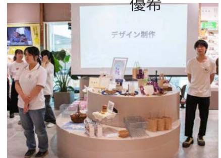
バックのスクリーンには、販売までのプロセスの動画