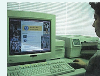
インターネットを使った当時の情報発信の様子 (W.B.1号より)

時代の転換期には前を向いて歩いていくしかありません。そこに多くのチャンスが転がっています。学生の皆さんがぜひ、変化をチャンスと捉え、新たな時代の担い手として活躍していただけることを期待しています。