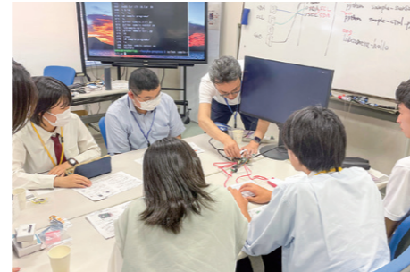
高校生による情報科学自由研究 2004年度から実施していた公開講座を 現名称で開講(2007年度～)