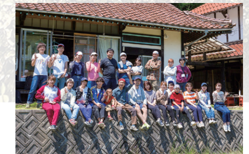
COC+ 文部科学省実施の事業に採択(2015～2019年度) 終了後は地域貢献の授業やプロジェクトとして継続