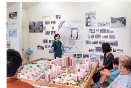
基町プロジェクト 芸術や地域交流活動を通じた 中区基町地区活性化プロジェクト