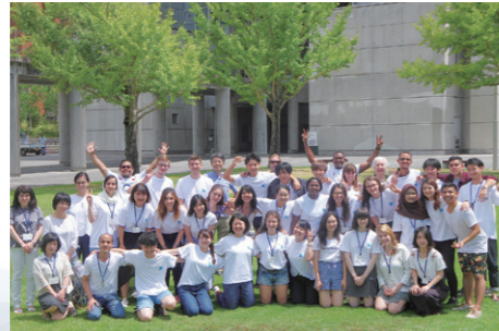
HIROSHIMA & PEACE 国内外の大学生たちがヒロシマについて学ぶ 夏期集中講座(2003年度～)