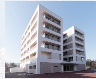
国際学生寮「さくら」