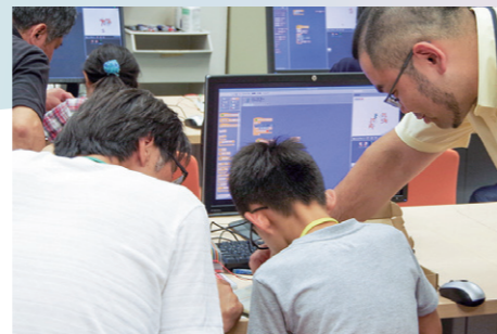
ひろしまコンピュータサイエンス塾 未来の科学者の育成を目指す小中学生対象 公開講座(2009～2020年度)