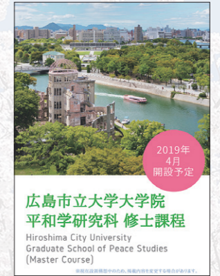
2019年 4月 開設予定 広島市立大学大学院 平和学研究科 修士課程 Hiroshima City University Graduate School of Peace Studies (Master Course)