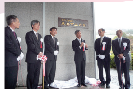
公立大学法人広島市立大学設置