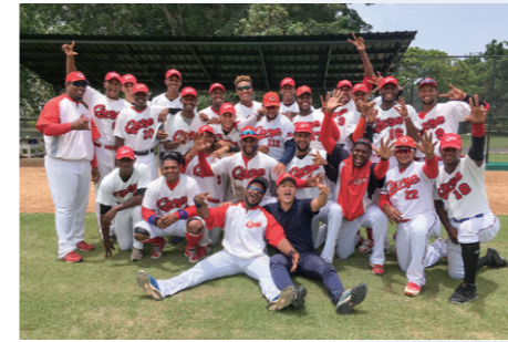
カープアカデミー・インターンシップ ドミニカ共和国での広島東洋カープ 企業インターンシップ(2009年度～)