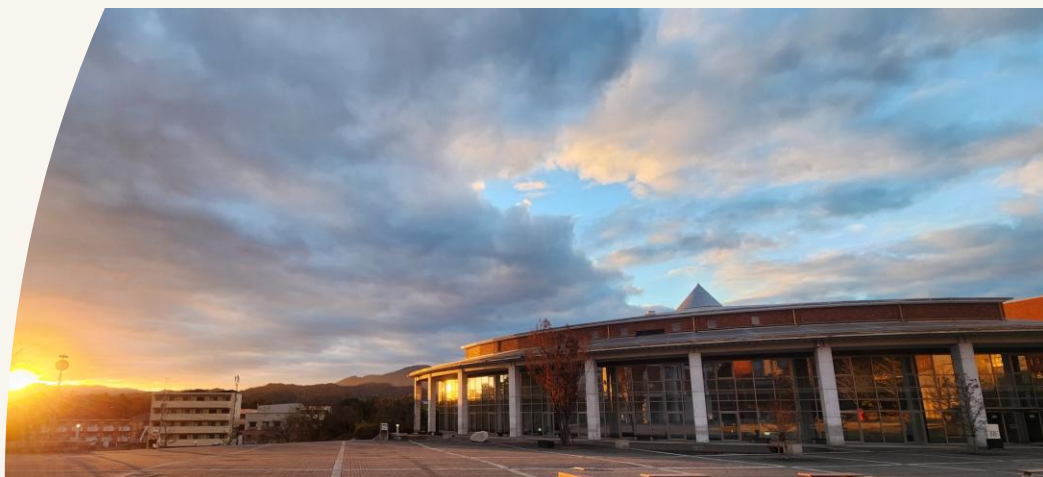
Hiroshima City University Graduate School of Information Sciences