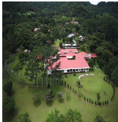
国連平和大学 (University for Peace)

国連大学の修士課程に世界中から集まる新入生へ「平和研究」のイントロダクションとして、9週間の平和学の基礎コースが実施されます。コースでは、国際関係学や政治経済学領域における平和研究の起源と発展を始めとし、紛争や暴力の根本原因と現代の社会状況において平和構築のための戦略を考察します。そして、ジェンダー、平和教育、人権や環境、といった平和構築に欠かすことのできない基礎を学びます。その基礎コースに市大生も参加することができます。