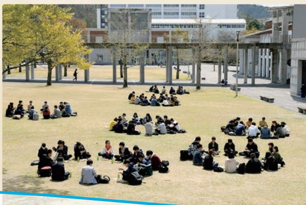
4月 / 3学部合同新入生オリエンテーション

広島市立大学では、毎年ユニークな行事やプログラムが実施されています。ここでは、いちだいの行事やプログラムの一部を紹介します。