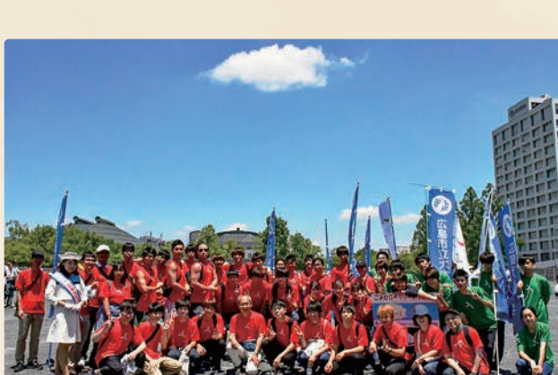
6月 / ごみゼロ・クリーンウォーク

毎年6月に、広島市内で「ごみゼロ・クリーンウォーク」が行われています。本学の学生たちもボランティアで参加し、袋町公園を出発地点とするコースを、大学オリジナルTシャツを着て旧市民球場跡地のゴールまで清掃しながら歩きます。