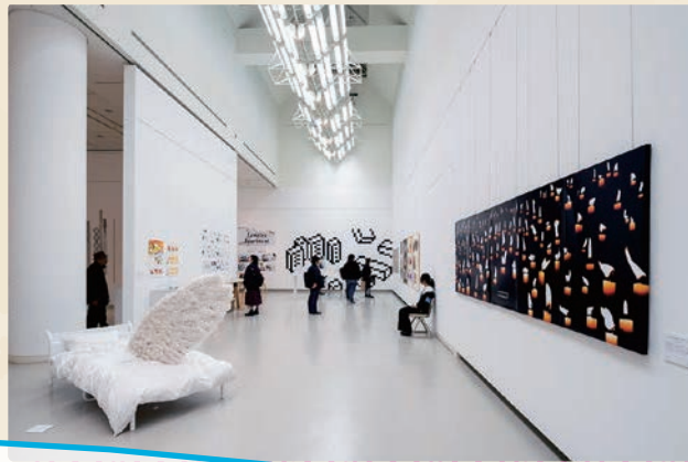
2月 / 卒業・修了作品展

本学芸術学部棟と、広島市現代美術館の2会場に分けて、4年間の学士課程、2年間の博士前期課程の研究制作の集大成となる卒業・修了制作作品を発表します。 ※2020年度の卒業・修了作品展の会場は未定です。