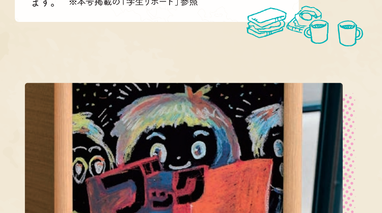
6月 / ブックハンティング(図書館)

学生生活上で支援(援助)を必要としている学生に対して、仲間である学生同士で気軽に相談に応じたり、手助けを行ったりするピア・サポート活動(本学での通称「いちピア」)のひとつとして、仲間づくり・居場所づくりを目的とした誰でも参加できるランチ会を開催しています。 ※本号掲載の「学生レポート」参照