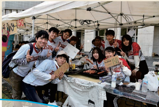
10月 / 大学祭

例年秋に開催される「市大祭」。学生たちによる模擬店、カフェ、フリーマーケットのほか、音楽、ダンスなどの各種クラブの発表、芸術学部学生の作品発表、そしてゲストを招いてのステージイベントなど盛りだくさんの内容で実施されています。