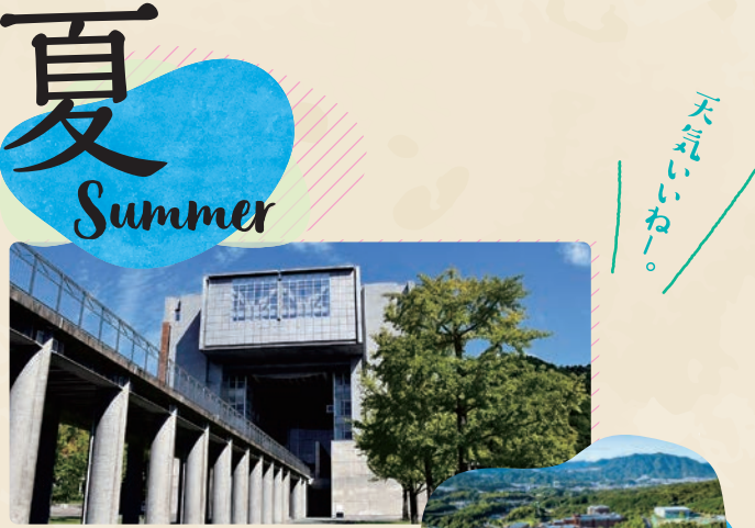
6~8月 / 地域課題演習

「長島愛生園」の視察(岡山県瀬戸内市) かつてはハンセン病患者の隔離施設として、現在、病気は治っているが社会復帰が難しい方の「終の棲家(ついのすみか)」として運営されています。一つの病気から生まれた偏見、差別の歴史を考えます。