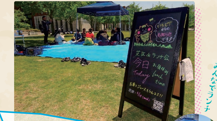
5月 / いちピアランチ会

学生生活上で支援(援助)を必要としている学生に対して、仲間である学生同士で気軽に相談に応じたり、手助けを行ったりするピア・サポート活動(本学での通称「いちピア」)のひとつとして、仲間づくり・居場所づくりを目的とした誰でも参加できるランチ会を開催しています。 ※本号掲載の「学生レポート」参照