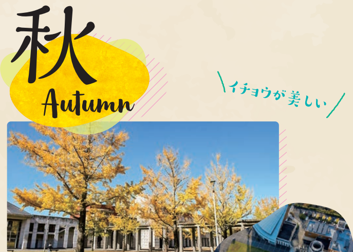
10月 / ビブリオバトル(図書館)

本学芸術学部棟と、広島市現代美術館の2会場に分けて、4年間の学士課程、2年間の博士前期課程の研究制作の集大成となる卒業・修了制作作品を発表します。 ※2020年度の卒業・修了作品展の会場は未定です。