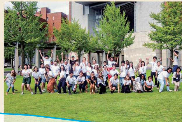
8月 / HIROSHIMA and PEACE

世界中から受講生が集まり、「ヒロシマ」と「平和」を学び語り合う、2週間の夏期集中講座。講義だけでなくフィールドワークなども企画されており、すべての参加者にとって貴重な体験となっています。 ※2020年度は開催方法を変更する予定です。