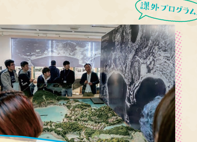
9月 / 市大塾学外研修

卒業生を大学に招き、行事を通じて同窓生同士、在学生や教職員など、市大にゆかりのある人たちとのつながりを深めるイベントです。卒業生・在学生・教職員・関係者なら誰でも参加OK。例年、各学部の同窓生によるトークセッションも実施しています。