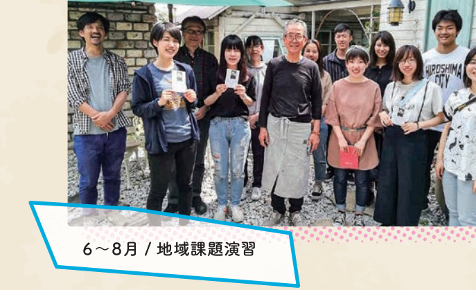
8月 / 長崎平和の鐘

地域貢献特定プログラムの1・2年次の科目「地域課題演習」では、広島広域都市圏の市町のさまざまな魅力や課題について、現地に向いて学習を行います。