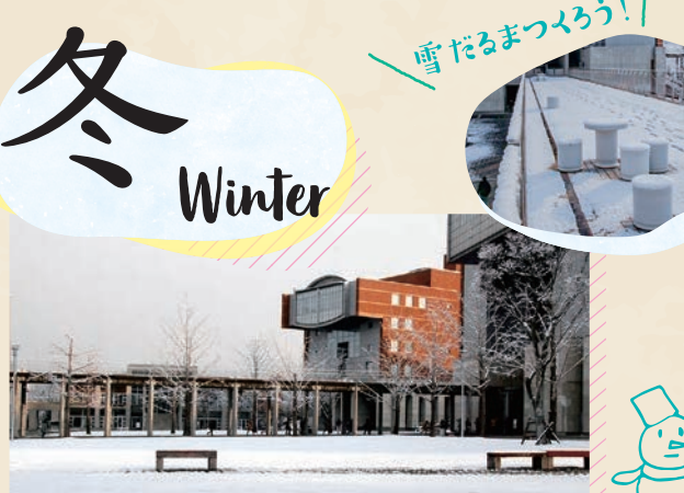
2月 / 卒業・修了作品展

例年秋に開催される「市大祭」。学生たちによる模擬店、カフェ、フリーマーケットのほか、音楽、ダンスなどの各種クラブの発表、芸術学部学生の作品発表、そしてゲストを招いてのステージイベントなど盛りだくさんの内容で実施されています。