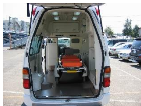
傾斜と回転による 2 自由度システムとして構成

救急搬送中に受ける慣性力の患者への悪影響（血圧変動、横揺れによる痛み、不快感）を低減することを目的に開発しました。車両加速度に基づいてベッドの姿勢を適切に変えることで、重力で慣性力を打ち消します。姿勢角は、DSPIに組み込まれたコントローラで2個のACモータを精度良く駆動することで制御します。血圧変動モデルとベッド駆動モデルに基づいて制御系を最適設計することで、血圧の変動を最小に抑えるベッドとして実現できます。