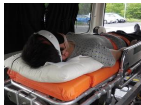
近赤外分光器を用いた脳血流変動の抑制効果の確認実験