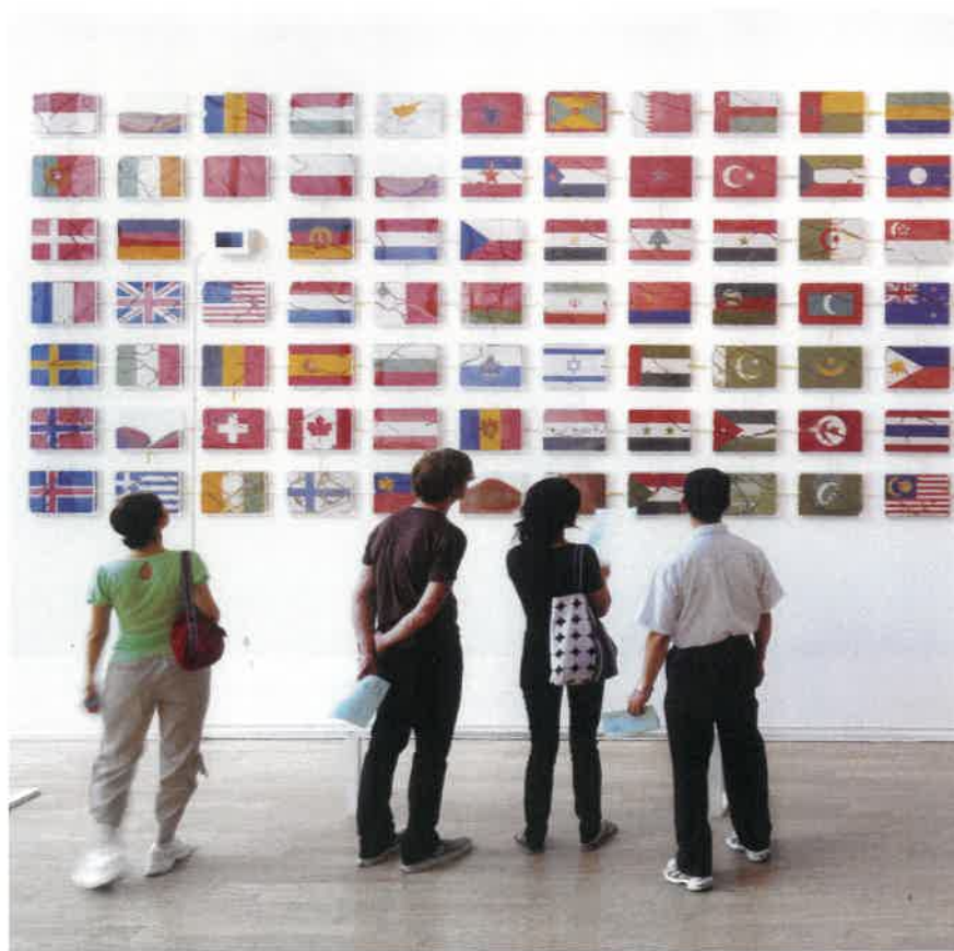
展示イメージの部分