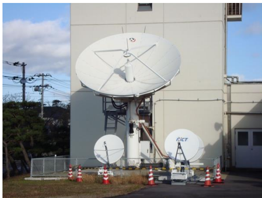
実験に使用した 5m 級アンテナを持つ大型地球局（中央）（情報通信研究機構 鹿島宇宙技術センターにて撮影）

提案技術である TCP-STAR を LINUX OS 内に実装しています。そして、実証実験を JAXA 筑波宇宙センターや情報通信研究機構 鹿島宇宙技術センターなどで実施しています。