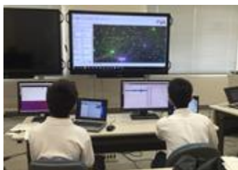
昨年度の研究風景