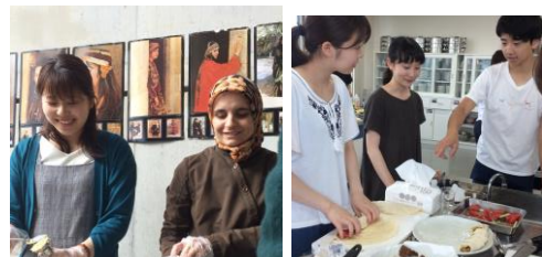
アラブ料理作りにも チャレンジしました。

【食文化】アラブ料理はおいしく、意外と(?)健康的です。広島の飲食業界や観光業界も注目する「ハラール・フード」に触れてみましょう。