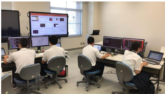
研究風景(※ 写真は一昨年)